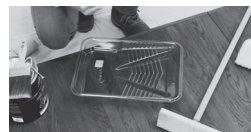
APPLIQUER À L'AIDE D'UN PISTOLET, D'UN PINCEAU OU D'UN TAMPON APPLICATEUR DE QUALITÉ