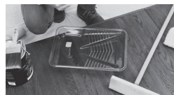
APPLIQUER À L'AIDE D'UN PINCEAU DE QUALITÉ, UN TAMPON APPLICATEUR OU PAR VAPORISATION.